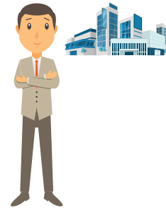
CFO Successor of Listed Co.

สำหรับผู้ที่เคยเป็น CFO ของบริษัทจดทะเบียน ที่หยุดปฏิบัติหน้าที่เกิน 1 ปี หากต้องการกลับเข้าทำงาน ต้องมีคุณสมบัติเสมือน ผู้ที่ได้รับการแต่งตั้งเป็น CFO ใหม่*