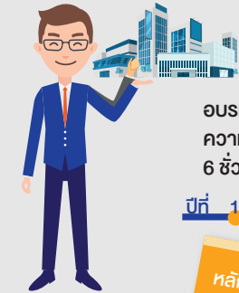
CFO of Listed Co.

อบรมหลักสูตรการพัฒนาความรู้ต่อเนื่องด้านบัญชี 6 ชั่วโมงต่อปี