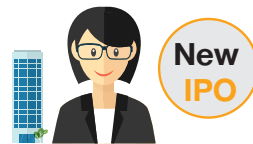
Chief Accountant of New IPO Co.