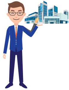
CFO of Listed Co.

ได้รับยกเว้นคุณสมบัติ ด้านการศึกษา ด้านประสบการณ์ทำงานและ ด้านการอบรมหลักสูตร Orientation 2