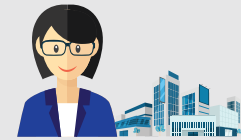
Chief Accountant of Listed Co.

อบรมหลักสูตรการพัฒนาความรู้ต่อเนื่องด้านบัญชี 6 ชั่วโมงต่อปี