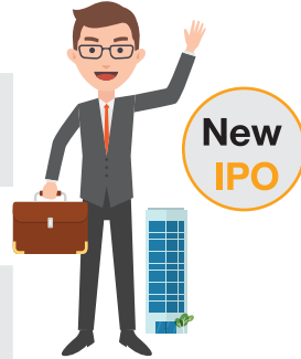
CFO of New IPO Co.

(ดูข้อกำหนดได้ที่ หนังสือเวียนของสำนักงาน ก.ล.ต. ที่ ก.ล.ต. กษ. (ว) 24/2560) 1